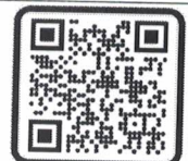
Camila Veras de Melo Cavalcanti Prefeita do Município de Baía Formosa/RN

Baía Formosa /RN, 11 de novembro de 2024.